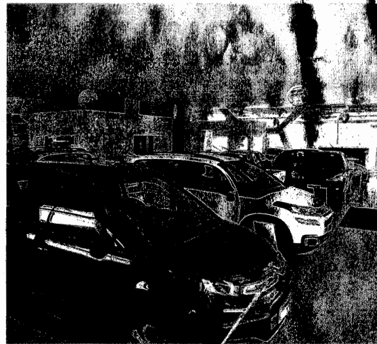
Os 2,6 mil veículos vendidos não fizeram com que outros comparativos tivessem a perspectiva negativa do mercado cearense revertida.

No acumulado do ano, a queda é de 25,5%. No caso dos ônibus, foram 1.169 unidades vendidas em março, baixa de 2,5%