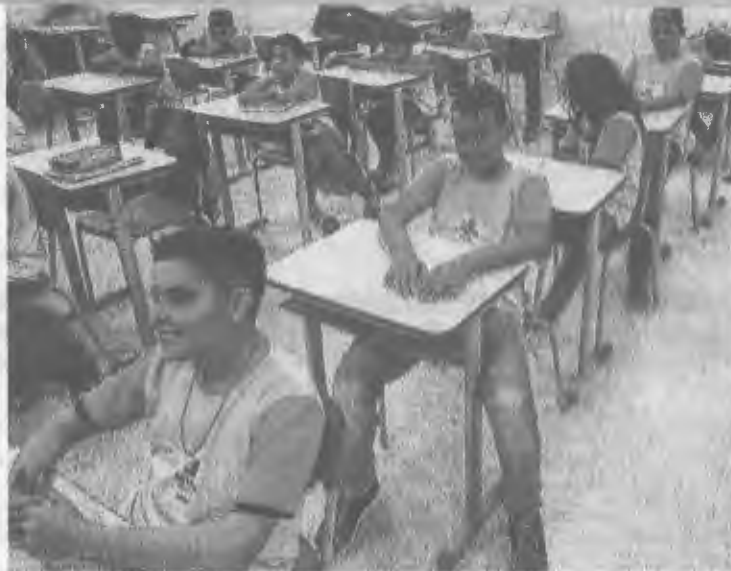
ESCOLA municipal recebe alunos do sexto ao nono ano

Hoje, Fortaleza conta com mais de 243 mil alunos matriculados na rede municipal, divididos em 616 equipamentos educacionais. Segundo Sarto, 66% dos estudantes estão em tempo integral. Na unidade inaugurada no bairro Presidente Vargas, o número de vagas