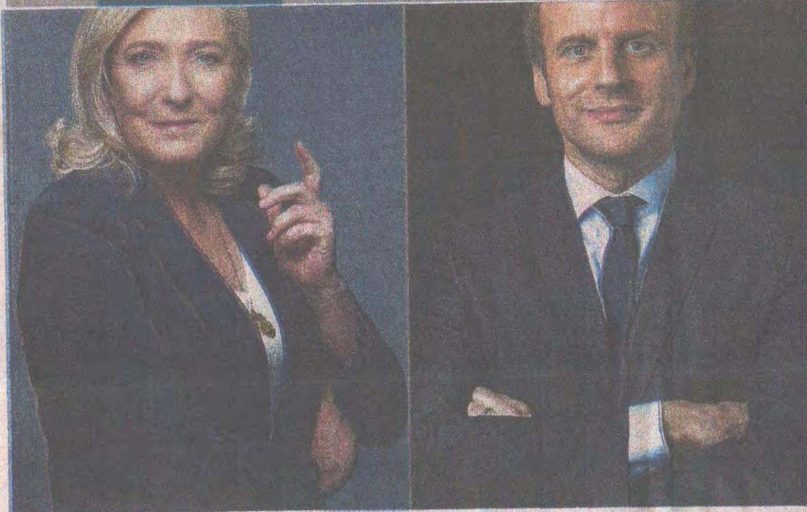
MARINE Le Pen e Emmanuel Macron estão no 2º turno

A França reviverá um segundo turno entre o centrista Emmanuel Macron e a ultradireitista Marine Le Pen, os dois candidatos mais votados no primeiro turno das eleições presidenciais desse domingo (10), com uma vantagem maior do que o esperado a favor do presidente.