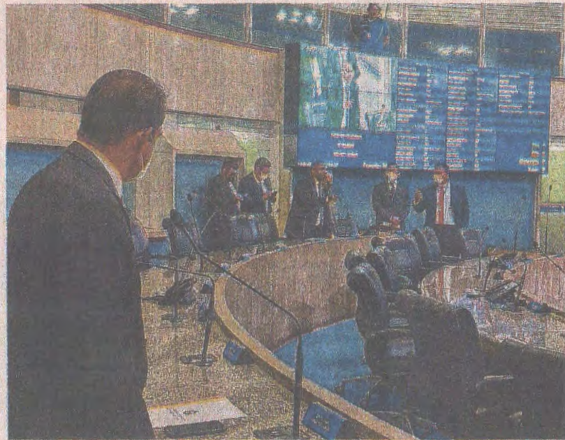
DEPUTADOS subiram o tom nos discursos da sessão de ontem na AL-CE

"É CPI para fazer politicagem, para fazer palanque. CPI para gerar manchete de jornal e assassinar reputações (...). Essa CPI é para desgastar a imagem do maior adversário do grupo que